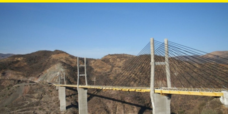
CONSTRUCCIÓN DE PUENTES